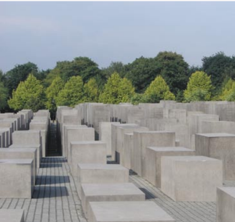
■ Denkmal für die ermordeten Juden Europas