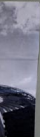
...chte ich dass der Krieg ... ca. 2 Kilometer von den