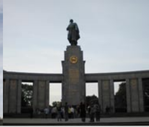
■ Sowjetisches Ehrenmal im Tiergarten

und ein entsprechendes Verhalten angemessen wäre. In den meisten Antworten konnte man nachvollziehen, dass das Ehrenmal im Treptower Park, wie auch andere sowjetische Ehrenmale, tendenziell negativ wahrgenommen wird. Das resultiert aus den unterschiedlichen Interpretationen des Zweiten Weltkrieges. Ein Besucher hat gesagt, dass in westlichen Massenmedien die Rolle der Sowjetunion unterschätzt wird. Auch andere Aussagen wie „Die Sowjetunion ist heutzutage für uns nicht so wichtig“ unterstreichen diese Wahrnehmung. Dennoch waren sich die meisten Befragten dahingehend einig, dass die sowjetischen Soldaten in diesem Krieg Befreier waren. Wir haben als ein Ergebnis unseres Projektes einen Artikel geschrieben, in dem wir über die Rolle der sowjetischen Soldaten im Zweiten Weltkrieg zu reflektieren versuchten. Wie schon erwähnt, wussten die meisten Befragten über die Existenz des sowjetischen Ehrenmals in der Schönholzer Heide wenig oder nichts. Um dies zu ändern, haben wir als zweites Ergebnis, eine Führung für die Beteiligten im Programm Berlin-Stipendien zu diesem Ehrenmal organisiert, die großes Interesse fand. Während unserer Exkursion haben wir über die Vor- und Nachkriegsgeschichte dieser Gegend erzählt und Fakten über das Ehrenmal vorgestellt. Es war ungewöhnlich und lehrreich, die Präsentation nicht im Seminarraum, sondern am Ort durchzuführen, wo man alles selbst sehen und darüber reflektieren kann.