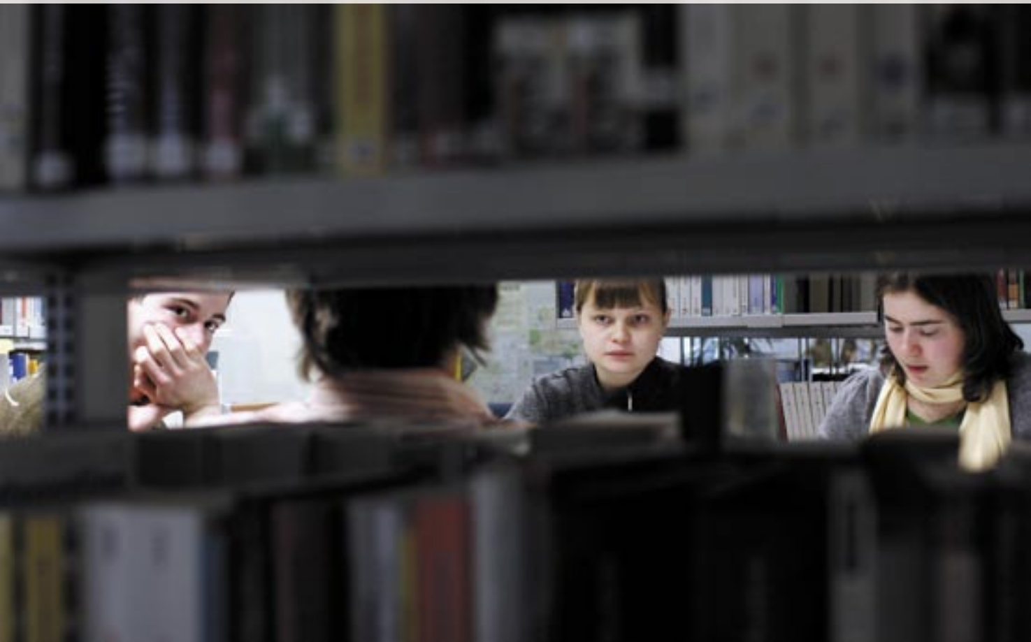
■ Die Projektgruppe bei der Arbeit in der Bibliothek

Das Fazit der Interviews bestand darin, dass die Menschen gleichzeitig verschiedene Informationsquelle benutzen müssen, um ein glaubwürdiges, differenziertes Bild zu erhalten.