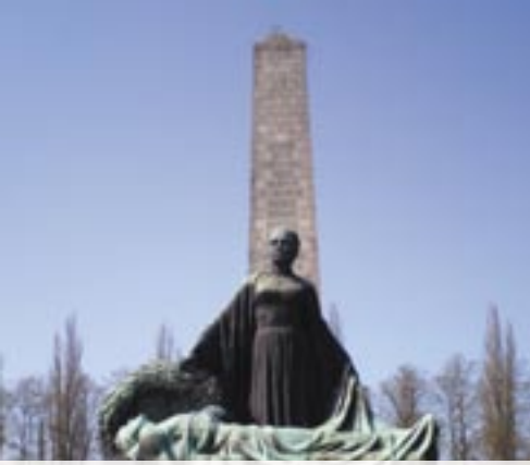
■ Sowjetisches Ehrenmal in der Schönholzer Heide