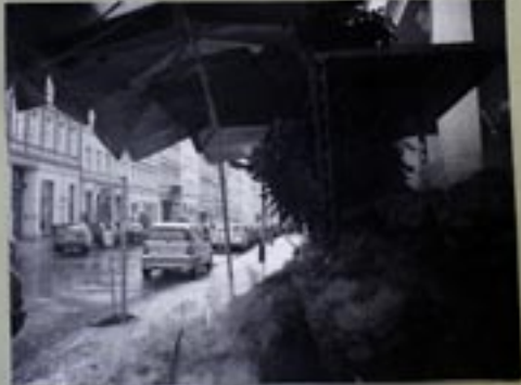
Heutzutage fühlt sich Frau G in dem ehemaligen West-Berlin genauso zu Hause, wie in Parkow. Sie steht