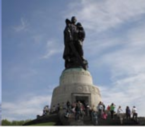
■ Sowjetisches Ehrenmal im Treptower Park