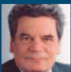
Dr. h.c. Joachim Gauck Vorsitzender von Gegen Vergessen – Für Demokratie e.V.

Die Errichtung der Stiftung war ein bedeutendes Hoffnungszeichen, das unsere Zivilgesellschaft errichtet hat.