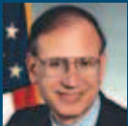
Stuart E. Eizenstat Botschafter, USA

Kein Land ist in der Geschichte jemals im Ergebnis eines Krieges eine solche umfangreiche Verpflichtung eingegangen. (...) Der Kompromiss, den wir erreicht haben, konnte zur Gerechtigkeit beitragen und zugleich der deutschen Wirtschaft Rechtsfrieden zusichern.