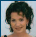
Iris Berben Schauspielerin

Die Errichtung der Stiftung war ein bedeutendes Hoffnungszeichen, das unsere Zivilgesellschaft errichtet hat.