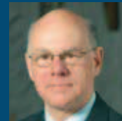
Prof. Dr. Norbert Lammert Präsident des Deutschen Bundestages

Wir müssen geeignete Wege finden, die stattgefundenen Verbrechen der nachwachsenden Generation zu erklären. Junge Leute wollen wissen, was geschehen ist, und warum es geschehen konnte. Dabei geht es nicht um geschichtliches Wissen allein, sondern um politische Orientierung. Denn Freiheit und Demokratie, Toleranz und Humanität sind keine selbstverständlichen Gewissheiten. Sie setzen das fortdauernde Engagement jedes Einzelnen von uns voraus. Das zu befördern, kann und sollte zentraler Anspruch der Förderaktivitäten der Stiftung EVZ sein.