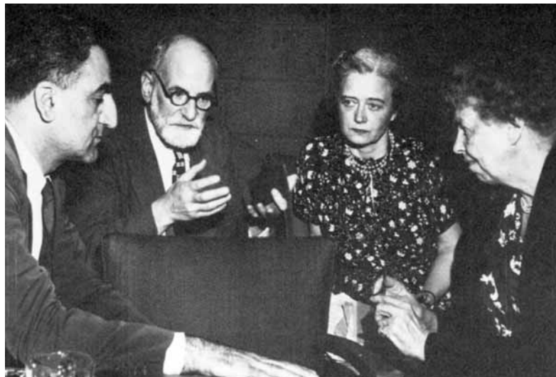
Drei der wichtigsten Akteure bei der Erarbeitung der AEMR (v.l.n.r.): Charles Malik (Libanon), René Cassin (Frankreich), eine Beraterin des Außenministeriums und Eleanor Roosevelt, die Witwe des US-Präsidenten Franklin D. Roosevelt

anderer Stelle auf die Möglichkeit einer Einschränkung dieses Rechts hin (Art. 29), um den Missbrauch der „Rechte und Freiheiten“ einzuschränken. Eine Art Generalklausel (Art. 30) erklärt abschließend, dass „keine Bestimmung dieser Erklärung dahin ausgelegt werden [darf], dass sie für einen Staat, eine Gruppe oder eine Person irgendein Recht begründet, eine Tätigkeit auszuüben oder eine Handlung zu begehen, welche die Beseitigung der in dieser Erklärung verkündeten Rechte und Freiheiten zum Ziel hat.“