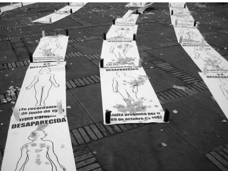
Das „Verschwindenlassen“ gehört zu den Menschenrechtsverbrechen, zu deren Verhütung und Bestrafung die UNO in den letzten Jahren eigene Konventionen erarbeitet hat. Hier eine Demonstration mit den Namen zahlreicher Opfer im Zentrum von Bogotá, Oktober 2007

Ungeachtet aller natur- und vernunftrechtlicher, moralischer oder auch theologischer Begründungen, die in interkulturellen Diskursen bemüht werden, sind es nicht zuletzt konkrete Erfahrungen von Gewalt, Unrecht und Unterdrückung, welche die Aktualität und Überzeugungskraft der Menschenrechte ausmachen. Die große Leistung bei der Entwicklung von Menschenrechtsnormen bestand darin, auf historisch-spezifische Unrechtserfahrungen allgemeine Antworten zu geben, die auch für den Umgang mit heutigem und künftigem Unrecht von Bedeutung sind. So ist beispielsweise das Diskriminierungsverbot, das der nationalsozialistischen Rassenideologie entgegengestellt wurde, bis heute ein zentrales menschenrechtliches Prinzip, das auch bei gegenwärtigen Diskriminierungen unterschiedlicher Art und Schwere zur Anwendung kommt - von der Diskriminierung der „Unberührbaren“ (Dalits) in Indien über den Umgang mit Sinti und Roma in Europa bis hin zur Benachteiligung von Afrikanern auf dem deutschen Wohnungsmarkt. Als Produkte der Geschichte unterliegen freilich auch Menschenrechte einem Wandel. Vor dem