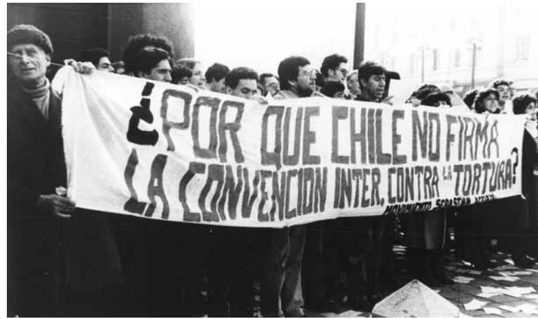
Die „Bewegung gegen die Folter“ demonstrierte während der Pinochetdiktatur in Chile und fragte auf dem Transparent, warum die Regierung die Konvention gegen die Folter nicht unterschreibt

Die AEMR und die beiden UN-Pakte bildeten die Grundlage sämtlicher weiterer universeller Menschenrechtsnormierungen, die seither in beeindruckender Zahl vorgenommen wurden. In oft zähen Verhandlungen entstanden UN-Konventionen zu einzelnen Rechten oder für besonders gefährdete Personengruppen. Hierzu zählen UN-Konventionen gegen Rassendiskriminierung, Frauendiskriminierung und zum Folterverbot sowie Übereinkommen zum Schutz der Rechte von Kindern, Wanderarbeitnehmern oder zuletzt auch Menschen mit Behinderung. Teils parallel zur Kodifizierung universeller Menschenrechtsnormen entwickelten sich vor allem in Europa, aber auch in Amerika starke regionale Menschenrechtsschutzsysteme, während entsprechende Bemühungen in Afrika noch in den Kinderschuhen stecken und in Asien erst noch entwickelt werden müssen. Hinzu kommt, dass