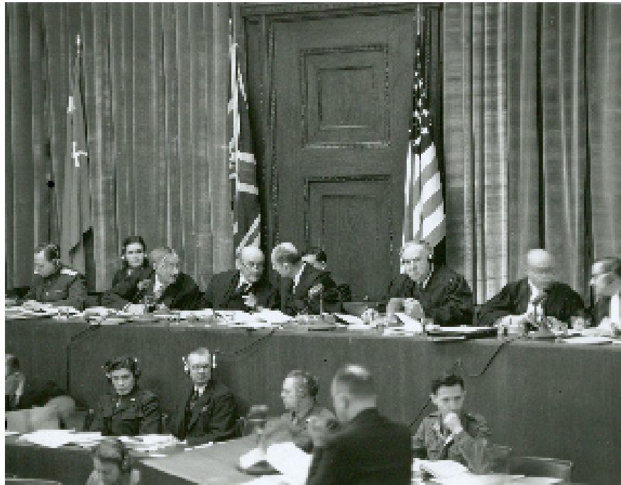
Die acht Richter des IMT in Nürnberg

A us heutiger Sicht besteht die rechtsgeschichtliche Bedeutung der Nürnberger Prozesse in der Festschreibung persönlicher Verantwortlichkeit auch von höchsten politischen Verantwortlichen vor internationalen Instanzen der Rechtsprechung für bestimmte Verbrechen. Unter diesen in Nürnberg international angeklagten Verbrechen sind dabei die „Verbrechen gegen die Menschheit“ diejenigen, die am stärksten die seitherigen Fortschritte des Völkerstrafrechts bestimmt haben. Seit Nürnberg hat sich eine neue Auffassung im Völkerrecht durchgesetzt, die solche Verbrechen allmählich der staatlichen Souveränität entzogen und zu einer Angelegenheit der ganzen Staatengemeinschaft gemacht hat. Wie ein Staat seine eigenen Bürger behandelt, sollte nicht mehr ausschließlich seine eigene Angelegenheit bleiben.