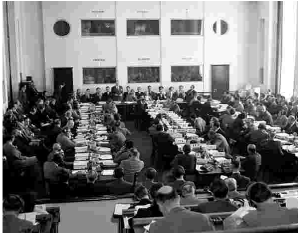
Eine Sitzung der Völkerrechtskommission 1951 in Genf

Die französische Regierung schlug ferner vor, die Delikte, die in der Völkermord-Konvention bezeichnet sind, mit in die Definition der „ Crimes contre l'humanité ou de lèse-humanité “ aufzunehmen 72 . Schließlich wollte sie, in Analogie zu den Genfer Konventionen, weitere Verbrechen „gegen die Integrität und Würde des Menschen“ 73 aufnehmen, wie die Folter, medizinische Experimente sowie generell grausame, erniedrigende und diskriminierende Behandlungen. Dieser